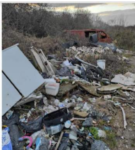
Dépôts sauvages sur le territoire de Génissac en mars 2022